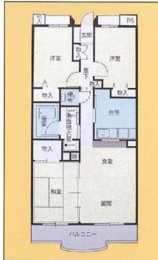
Bタイプ 3LDK 65.49㎡