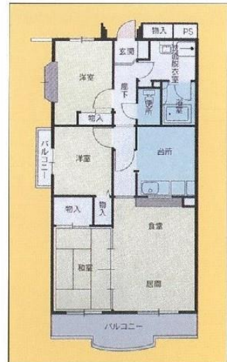
Cタイプ 3LDK 65.49㎡