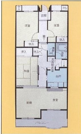
Aタイプ 3LDK 70.76㎡