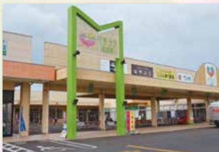
モテナス芳賀 約 1.4 km