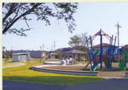
あおぞら公園 約 1.4 km