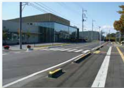
総合情報館 約 2.0 km