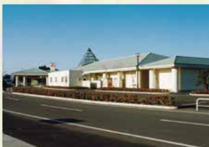
ロマンの湯 約 2.5 km