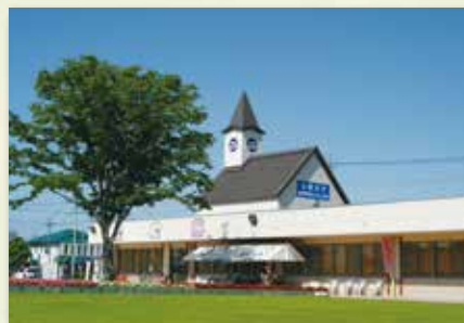
道の駅はが 約 2.4 km