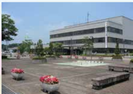
芳賀町役場 約 2.0 km