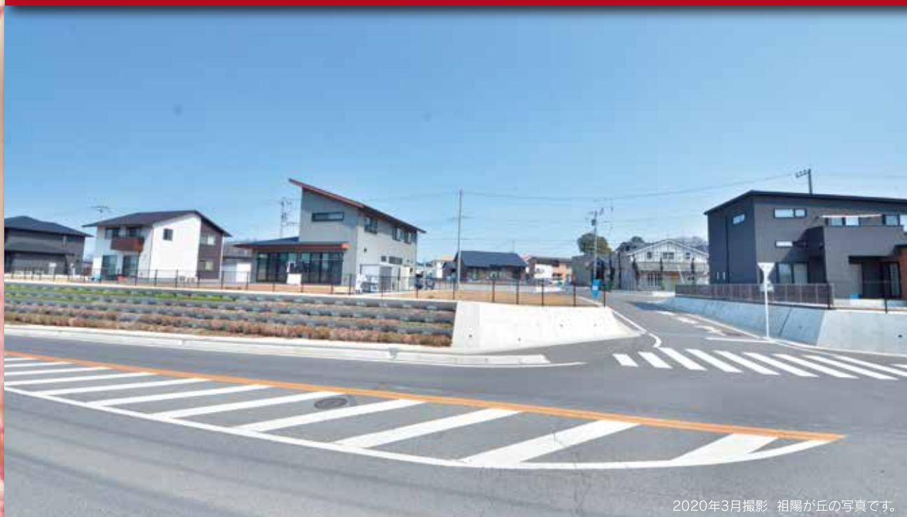
2020年3月撮影 祖陽が丘の写真です。