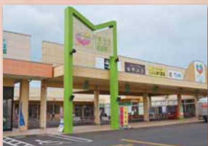
モテナス芳賀 約 1.4 km