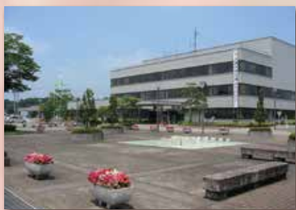
芳賀町役場 約 2.0 km