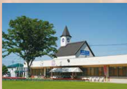
道の駅はが 約 2.4 km