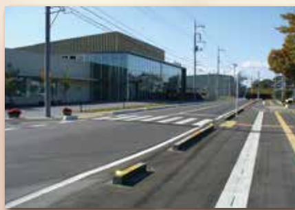
総合情報館 約 2.0 km